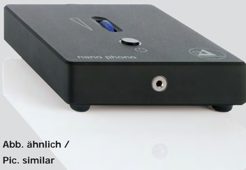
Abb. ähnlich / Pic. similar