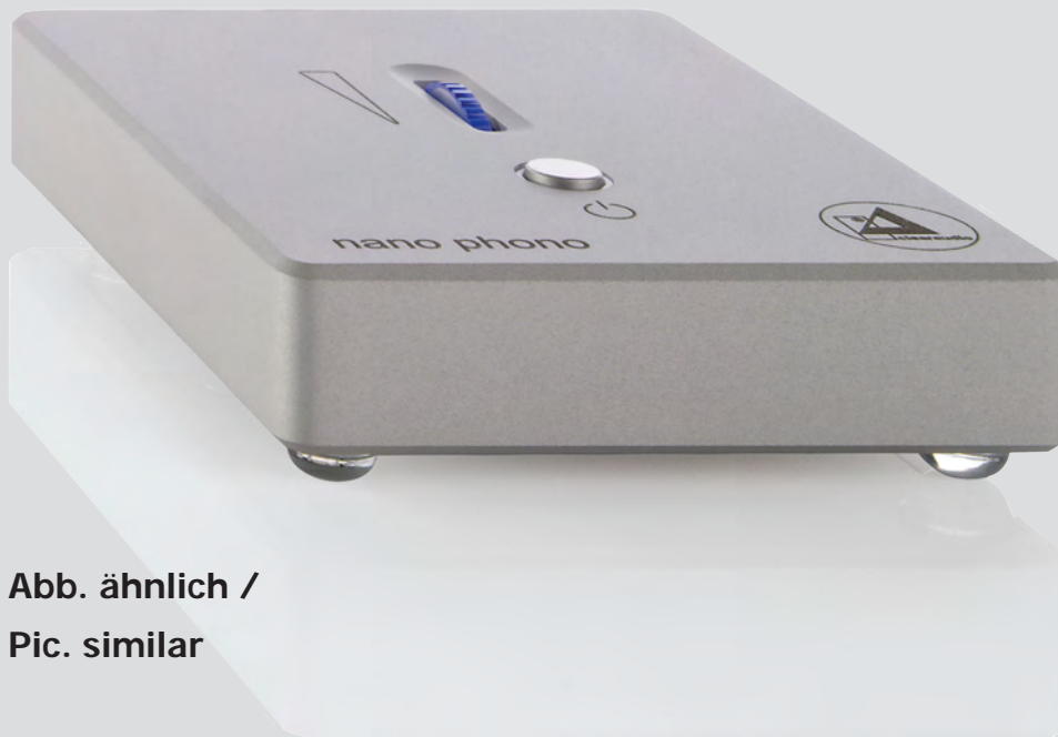
Abb. ähnlich / Pic. similar