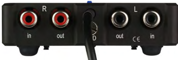
Abb. 4: Rückansicht

4. Bitte schließen Sie erst jetzt das Gerät an das Stromnetz an und schalten Sie das Gerät ein!