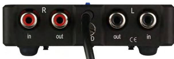
Pic. 4: Rear view

4. The very last thing to do is to connect the power supply to the mains and press the power button to the "ON" position.