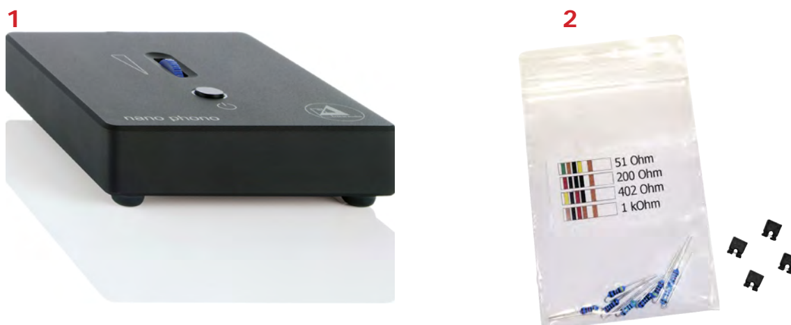
Pic. 1: Package contents

Please check the contents of you're newly purchased phono preamplifier .