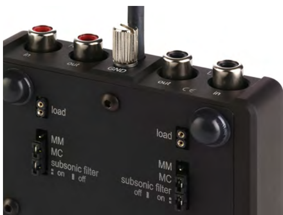
Abb. 3: Geräteunterseite