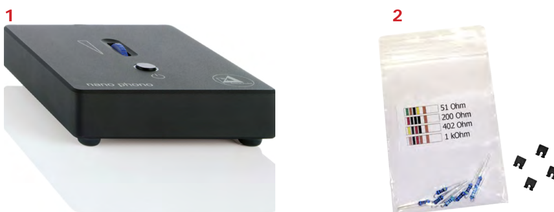
Abb. 1: Lieferumfang

Bitte kontrollieren Sie den Lieferumfang Ihrer neu erworbenen nano phono V2 Phono-Vorverstärker auf deren Vollständigkeit: