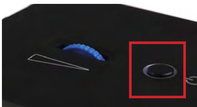
Abb. 5: Druckknopf

Falls das Gerät eine längere Zeit nicht in Benutzung ist, schalten Sie das Gerät oben am Druckknopf (siehe Bild) aus. Oder trennen Sie das Gerät komplett vom Stromnetz in dem Sie das Steckernetzteil aus der Steckdose entfernen.