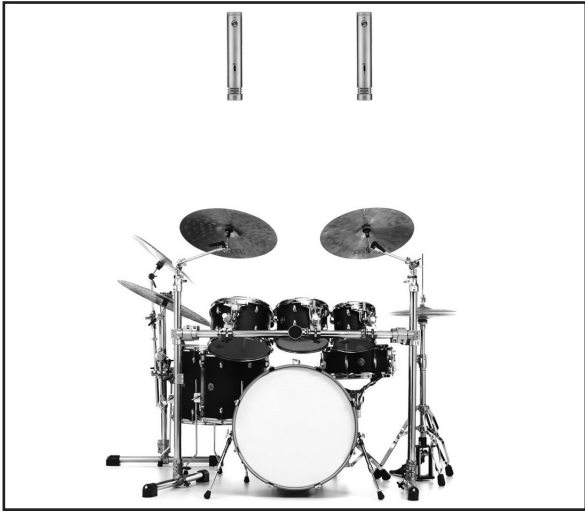
In this diagram, two WA-84's are used in a spaced pair configuration to record stereo drum overheads.